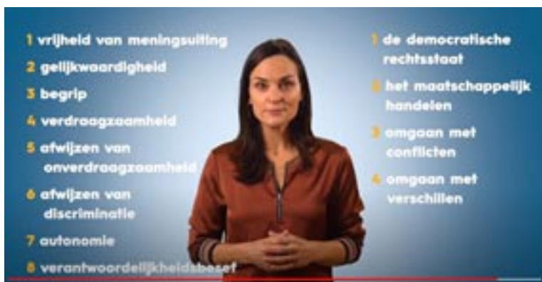
Aandachtspunten in het curriculum voor burgerschapsonderwijs

werken aan actieve participatie en sociale cohesie (wetswijziging 2006) en aan non-discriminatie en verdraagzaamheid (wetswijziging 2021).