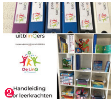
2 Handleiding voor leerkrachten