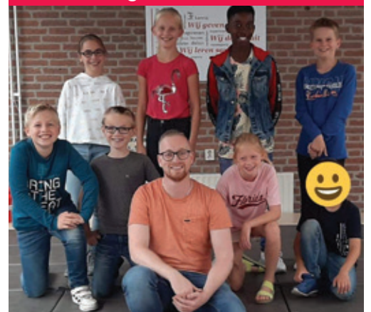
Leerlingenraad IKC Triade