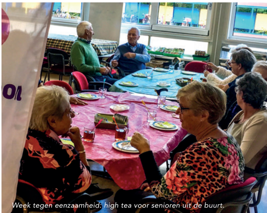
Week tegen eenzaamheid: high tea voor senioren uit de buurt.

"Een tip voor scholen die ook willen gaan samenwerken met partners in de buurt is dat je eerst moet investeren in de contacten. Het kost tijd om zichtbaar te zijn en een band op te bouwen. Het is goed om daar iemand voor te hebben. Ik vind het erg fijn dat ik de tijd krijg om partners te zoeken, contacten te leggen en samenwerkingen aan te gaan."